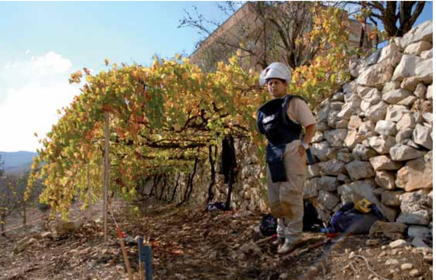
إحدى العاملات في نزع الألغام تطهر كرم عنب في الأردن - م. وبرهام

التوصية: الدفع من أجل مزيد من التوافق فيما يتعلق بمشاركة المجتمع المحلي في إجراءات التسليم، وطلب الوثائق والتقارير ذات الصلة من المساهمين حول مشاركة المجتمع بطريقة مفصلة توضح الجنس والعمر.