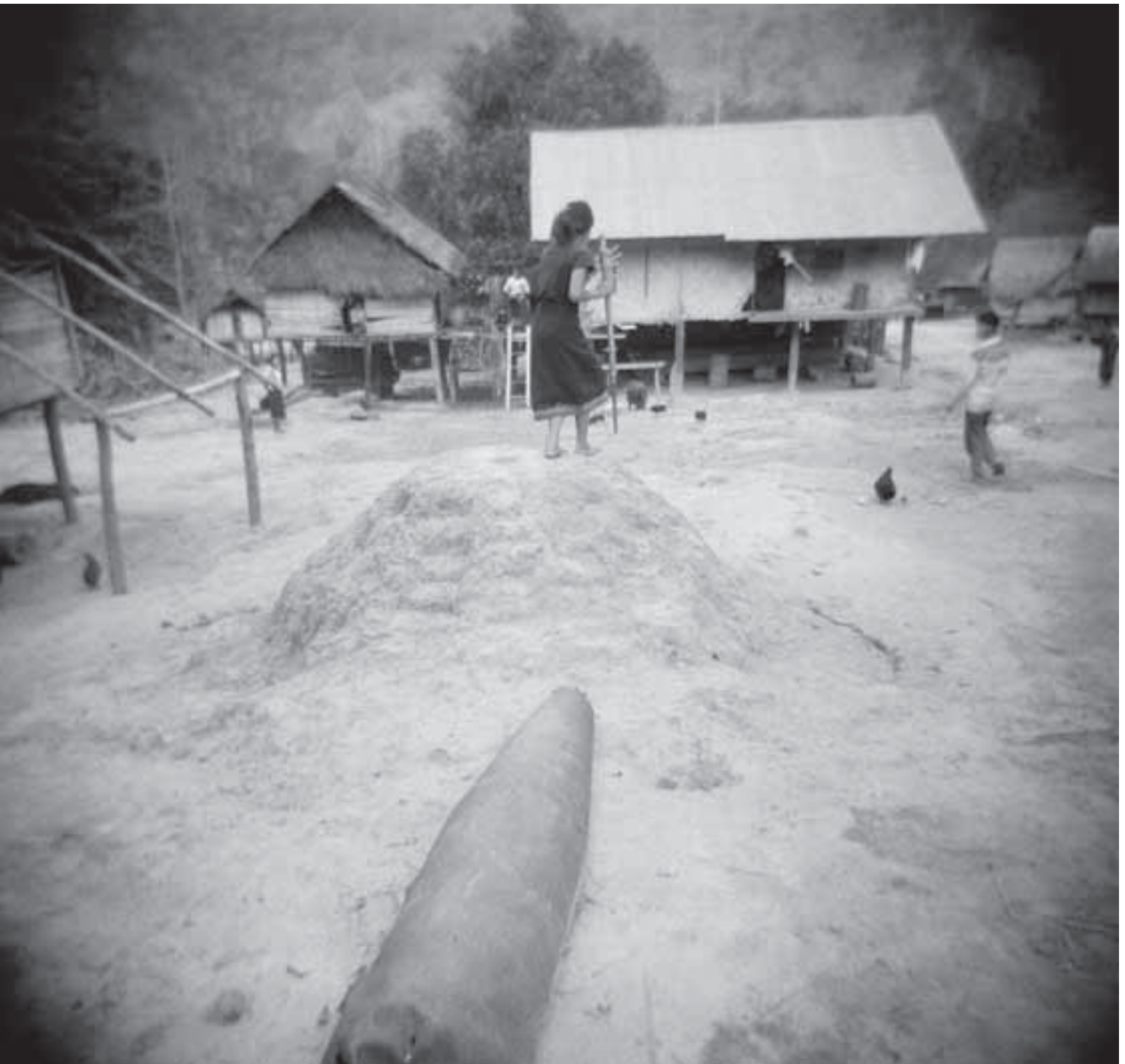
عبوة لقنبلة عنقودية في قرية تقع في منطقة سيبون، لاوس - ن. آميس

عندما تتم إزالة الألغام من قبل منظمة دولية غير حكومية، فقد تتجاوز المنظمات غير الحكومية الإجراءات الوطنية التشغيلية الموحدة (SOP) وتنظم مراسيم تسليم أكثر رسمية.