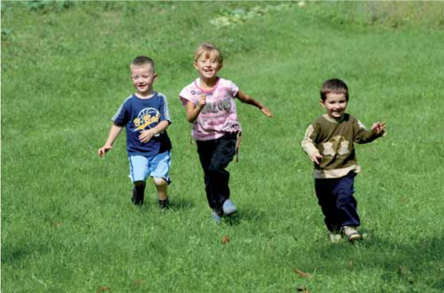
مع الأصدقاء مجدداً، البوسنة والهرسك - ب. جيفري

وبوجه عام فإن احتفالات تسليم الأراضي لا يتم تنظيمها في البوسنة والهرسك، على افتراض أن السكان في المناطق المهولة، وفي المجتمعات المتضررة يدركون جيداً عمليات المسح / التطهير ويعرفون أنه عند الانتهاء من تلك العمليات، تكون المنطقة قد أصبحت آمنة للاستخدام. وفي حال تنظيم مثل هذه الاحتفالات، فإنهم يفضلون عقدها في المناطق النائية كوسيلة لإبلاغ المجتمعات المحلية المتضررة بأن الأرض أصبحت آمنة للاستخدام، أو في المناطق ذات الأهمية الكبيرة للمجتمع. وأحياناً يتم تنظيم احتفالات التسليم للجهات المانحة من قبل الشركات لتسليط الضوء على المهام المكتملة، وإتاحة الفرصة للأفراد والمنظمات المهتمة للتعبير عن تقديرهم وشكرهم لجهود الجهات المانحة.