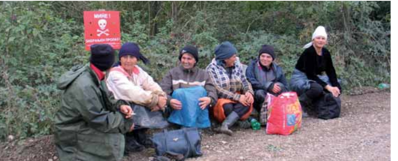
نساء يسترحن قبل بدء العمل في حقل تبغ، البوسنة والهرسك - د. ليسيك

من الواضح أنه بسبب القيود الثقافية في أفغانستان، لا تؤخذ قضايا المساواة بين الجنسين بعين الاعتبار خلال إجراءات التسليم. في حين تنص المعايير الأفغانية لمكافحة الألغام (AMAS 06.09) في مهام إجراءات التسليم على تشجيع المجتمعات المحلية المتضررة في المشاركة «كلما كان ذلك ممكناً»، يبدو أن أفراد المجتمع المتضرر من الإناث نادراً ما يتحصلون على معلومات مباشرة من منظمات مكافحة الألغام، مما في ذلك تسليم الأرض التي تم تطهيرها. وقد تم التأكيد على هذا في «تحليل سبل العيش في المجتمعات المتأثرة بالألغام الأرضية / المتفجرات من مخلفات الحروب في مقاطعة هيرات، بأفغانستان، في عام ٢٠١١».