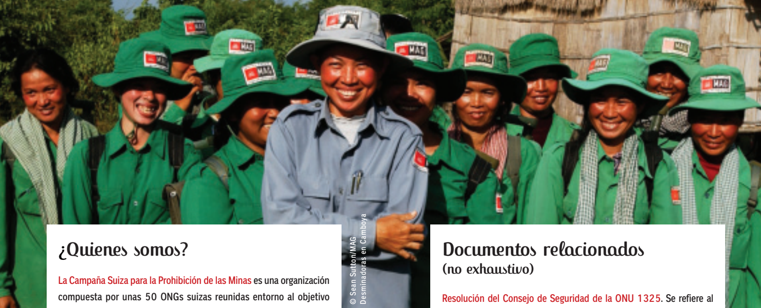
Desminadoras en Camboya